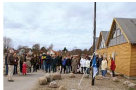
En frossen forsamling fejrer afslutningen på sæsonen.